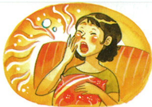
困 kùn 졸리다