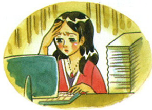
累 lèi 피곤하다