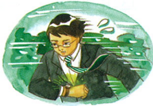
忙 máng 바쁘다